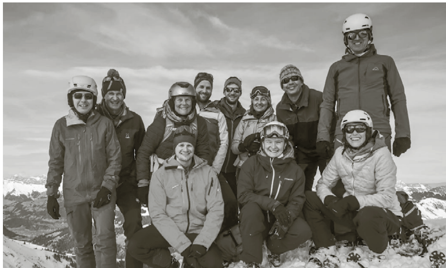
Skitour auf das Wistätthorn