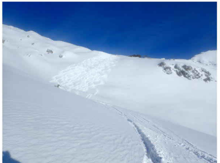
Asfalt nahe Strelapass