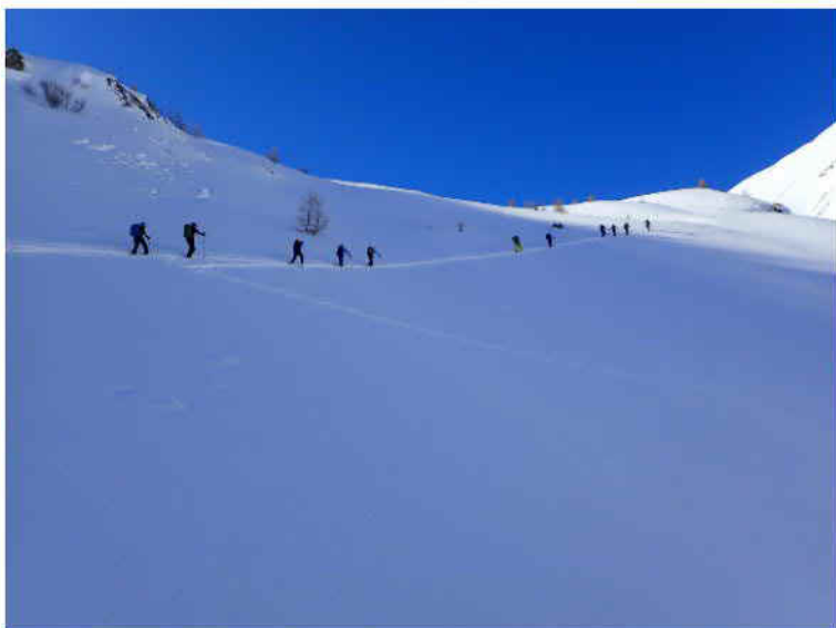
oberhalb Pkt 2039, Lodealp "Kühlschraube"