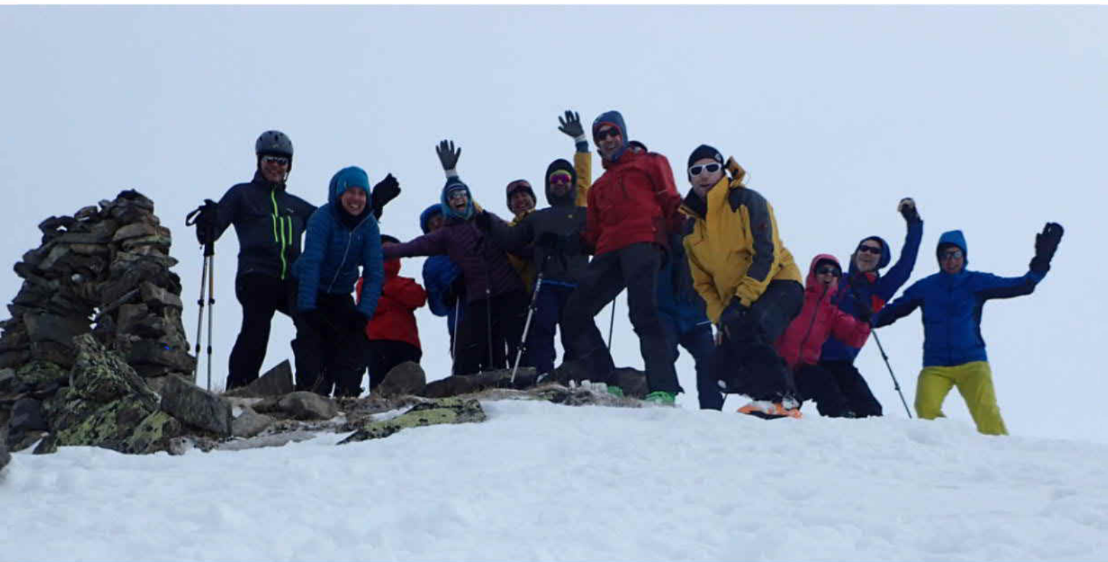
auf dem Büelenhorn