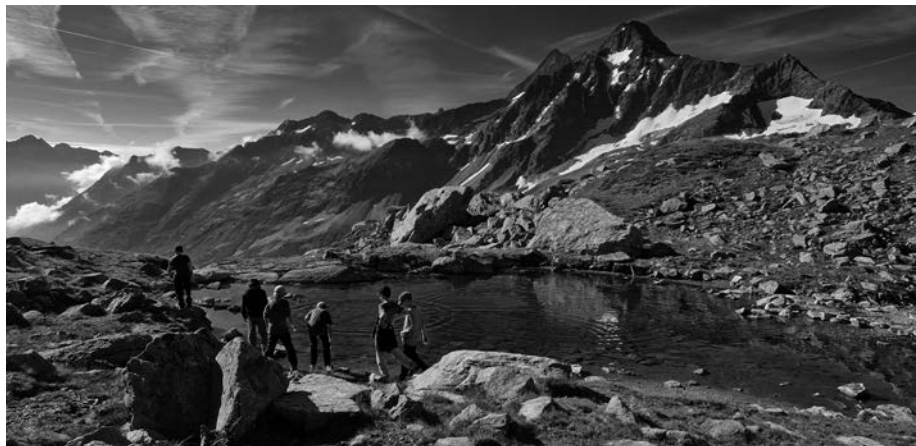
KiBe-Lager in der Sustlihütte